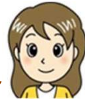
社会保険労務士 ゆうこりん

がんになると患者さんだけでなく、家族の生活も大きく変わります。患者さんのそばにいて、協力したいという気持ちはわかりますが、早まって介護や看病のために今の仕事を辞めないでください。